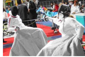
Dispositif « Handifix » Fauteuil